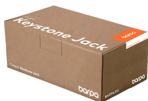
Boîte de 24 Unités

Ces images sont purement illustratives. Nous voulons que vous voyiez l'importance que nous attachons à l'emballage. Nous travaillons toujours avec des produits et des matériaux faciles à utiliser.