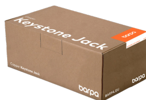
Boîte de 12 Unités - emballées individuellement